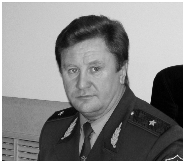
Юрий Денисов, начальник УФСКН России по Пензенской области

Данная отсрочка объяснялась необходимостью обсудить возможность данных ограничений с про-