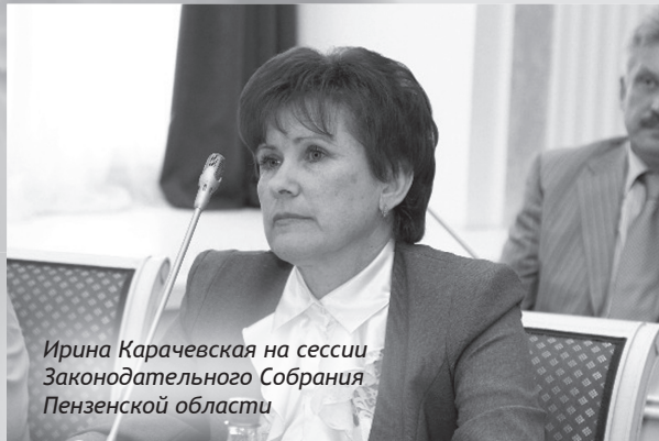
Ирина Карачевская на сессии Законодательного Собрания Пензенской области