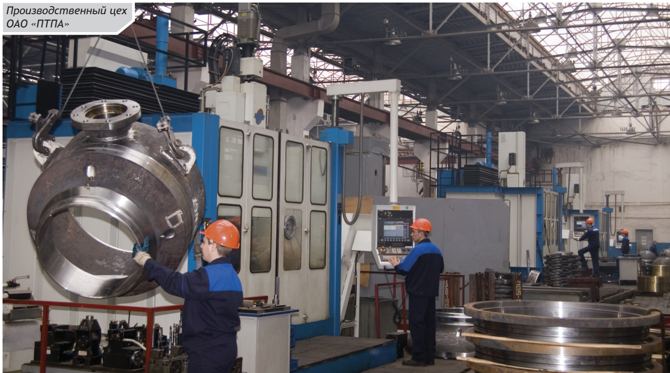
Производственный цех ОАО «ПТПА»

Действует специализированная программа «Жилье», направленная на оказание помощи работникам в улучшении жилищных условий. Уникальный детский проект «Шаг в будущее» за 9 лет существования вырос в образовательный центр городского уровня. Дети осваивают основы конструирования, радиоэлектроники, робототехники, журналистики, экономики и т.д. Это помогает им выбрать будущую профессию, пройти практику на предприятии, а лучшим — получить сертификаты на обучение в вузе. Традиционными стали летние сборы участников проекта в лагере на Черном море.