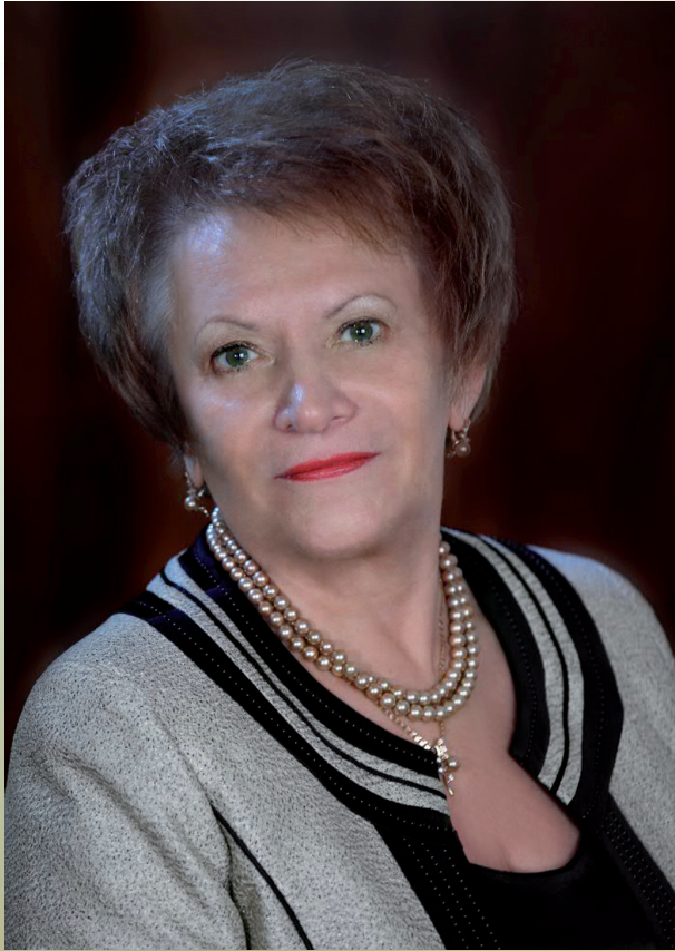
Уполномоченный по правам человека в Пензенской области Светлана Пинишина