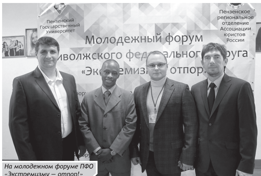
На молодежном форуме ПФО «Экстремизму — отпор!»

Также закон определяет круг субъектов, которым юридическая помощь может быть оказана бес-