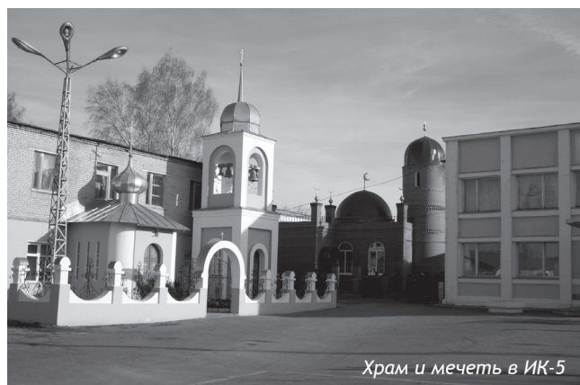
Храм и мечеть в ИК-5

Во всех учреждениях УИС региона созданы условия для обеспечения права осужденных на свободу вероисповедания. В исправительных колониях и следственных изоляторах (СИЗО) действуют 2 православных храма (ИК-4, ИК-8), 2 православные церкви (ИК-5, ИК-7), мусульманская мечеть (ИК-5), 4 православные молитвенные комнаты (ИК-1, ЛИУ-6, КП-12, СИЗО-1), 2 мусульманские молитвенные комнаты (ИК-1, КП-12). Мероприятия религиозного характера проводятся не реже 1 раза в месяц с привлечением представителей духовенства. Общины верующих осужденных составляют более 800 человек.