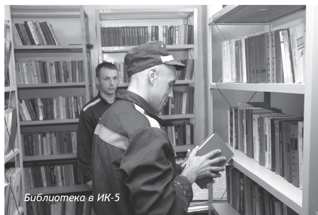
Библиотека в ИК-5

В каждом ИК и СИЗО действуют библиотеки (где находятся около 45 тыс. экз. книг — художественная, научно-популярная и правовая литература). Осужденные могут выписывать и периодические издания.