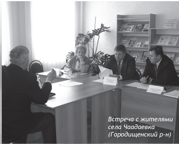
Встреча с жителями села Чаадаевка (Городищенский р-н)