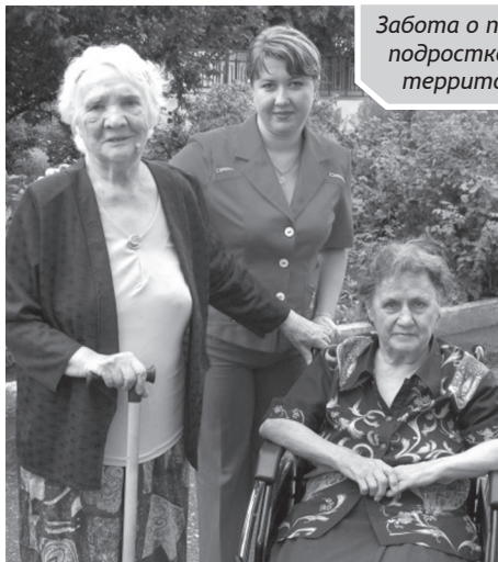
Забота о пожилых и профилактика подросткового неблагополучия — территория особого внимания

Сейчас ведется работа по внедрению технологии по профессиональной ориентации детей-инвалидов. Проект «Город мастеров» нацелен на создание образа профессий, приобретение детьми знаний и навыков, необходимых для профориентации, трудоустройство детей-инвалидов, содействие в трудоустрой-