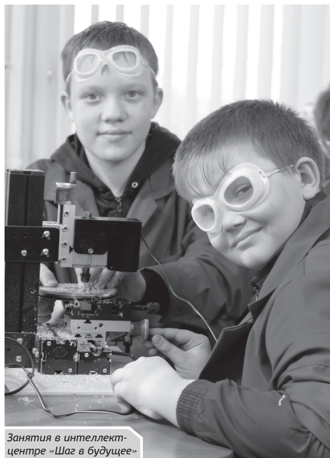
Занятия в интеллектуальном центре «Шаг в будущее»

Таким образом, профессии рабочего и инжене-