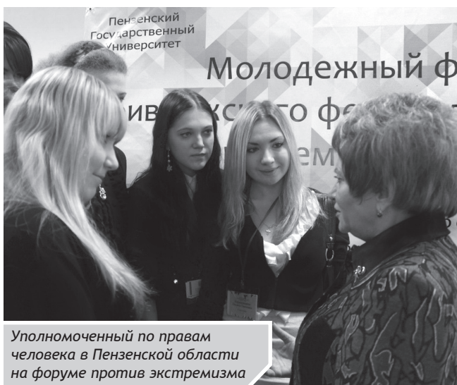
Уполномоченный по правам человека в Пензенской области на форуме против экстремизма

По информации, представленной в «Российской газете», начало проекту положила инициатива председателя Комитета Совета Федерации по конституционному законодательству и одновременно председателя Комиссии Ассоциации юристов России по правовой культуре и пропаганде права Алексея Александрова. Стратегическая задача про-