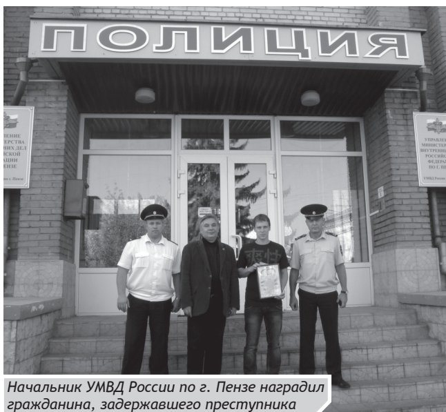
Начальник УМВД России по г. Пензе награждает гражданина, задержавшего преступника

— профилактические «Уроки безопасности» с целью разъяснения учащимся правил поведения для предупреждения опасных ситуаций.