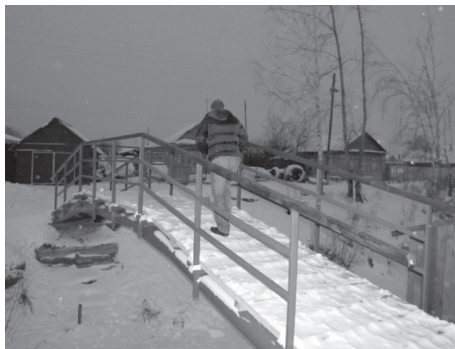
Регион-центр добился восстановления моста через р. Шукшу в п. Лунино

ряет принятие решения, а значит, повышает эффективность работы с гражданами.