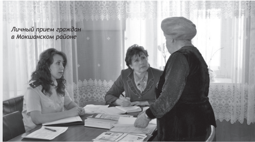
Личный прием граждан в Мокшанском районе